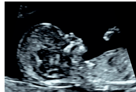
Abbildung: Profilbild eines Fötus in der 13. Schwangerschaftswoche

Bei circa 90% der Kinder mit Down-Syndrom (Trisomie 21) zeigt der Test ein «auffälliges» Ergebnis, aber der Test ist auch bei ca. 5% der gesunden Kinder auffällig (falsch-positiv). Wenn ein niedriges Risiko ermittelt wird (unauffälliges Ergebnis), sind keine weiteren speziellen Untersuchungen empfohlen.